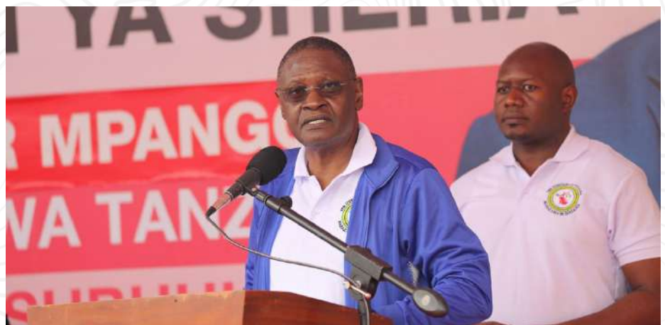
Jaji Mkuu wa Mahakama ya Tanzania, Mhe. Prof. Ibrahim Hamis Juma akihutubia wakati wa uzinduzi wa Wiki ya Sheria kwenye Viwanja vya Nyerere Square jijini Dodoma.