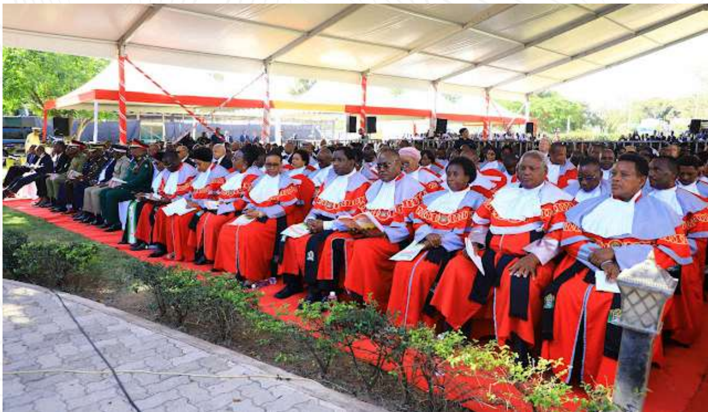
Majaji wa Mahakama ya Rufani na Mahakama Kuu ya Tanzania wakisikiliza hotuba ya Rais wa Jamhuri ya Muungano wa Tanzania Mhe. Dkt. Samia Suluhu Hassan tarehe 01 Februari, 2023 katika kilele cha Maadhimisho ya Siku ya Sheria nchini yaliyofanyika katika Viwanja vya Chinangali jijini Dodoma.