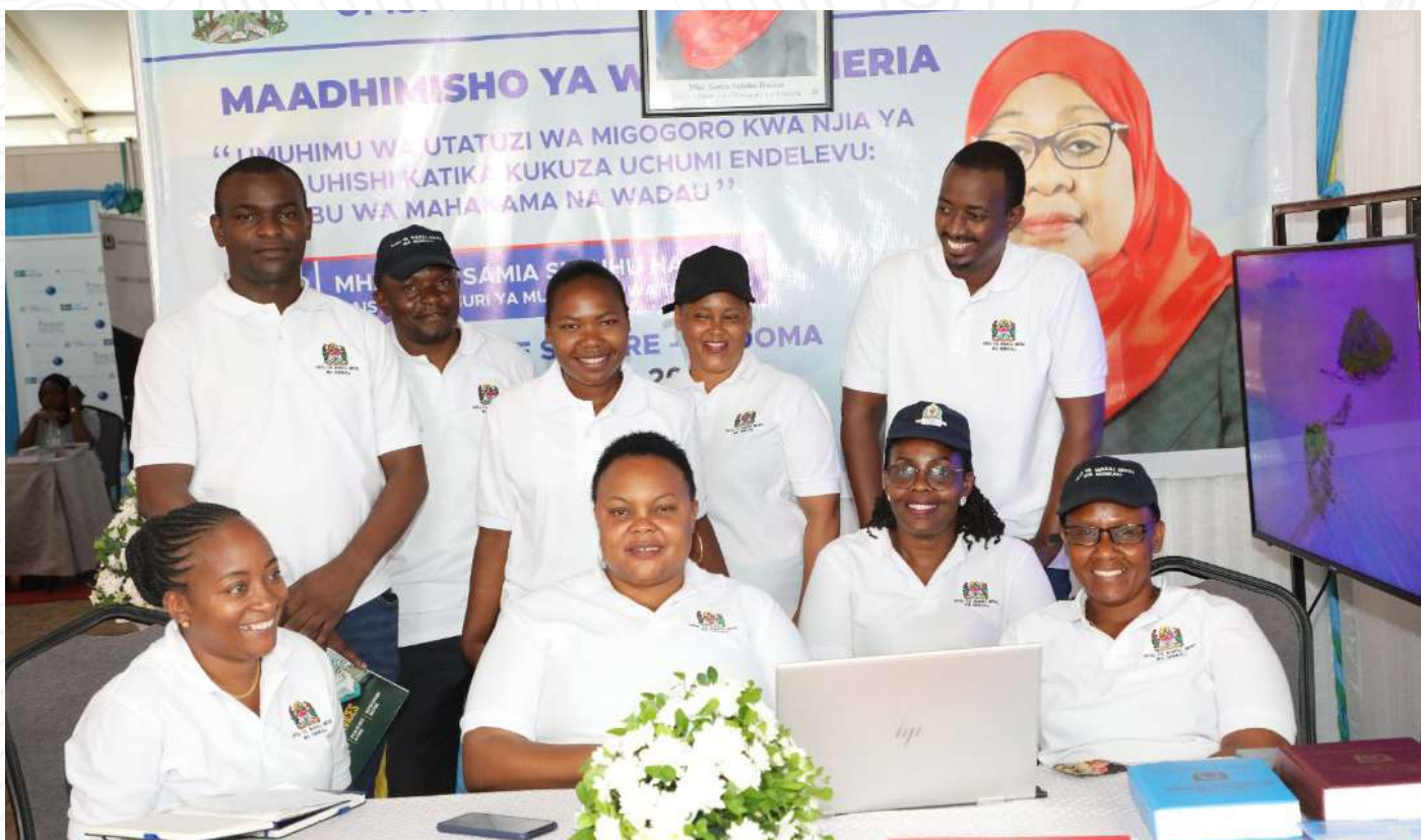
Baadhi ya watumishi wa Ofisi ya Wakili Mkuu wa Serikali wakiwa kwenye picha ya pamoja ndani ya banda la maonesho ya Ofisi hiyo kwa ajili ya kutoa elimu ya msaada wa kisheria na majukumu ya Ofisi hiyo kwa wadau na wananchi wakati wa Wiki ya Sheria iliyofanyika jijini Dodoma.