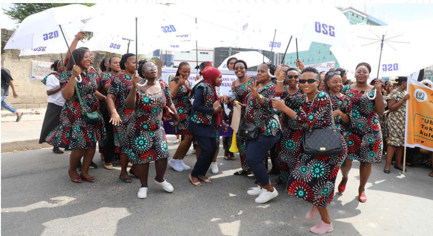
Baadhi ya wanawake kutoka Ofisi ya Wakili Mkuu wa Serikali wakisherehekea kilele cha Maadhimisho ya Siku ya Wanawake Duniani yaliyofanyika katika Viwanja vya Mnazi Mmoja Jijini Dar Es Salaam.

Alifafanua kuwa nchi yetu pia inatambua umuhimu na mchango wa mwanamke katika siasa, jamii na uchumi hivyo mwaka huu nchi yetu inaungana na nchi nyingine duniani kuadhimisha Siku ya Wanawake kama ambavyo na sisi mkoa wa Dar es Salaam tunaadhimisha siku hii muhimu.